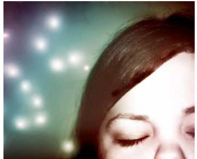
Ecouter à l'intérieur, illustration

Le grand défi lancé à l'homme moderne consiste à établir de meilleures communications avec le divin Moniteur qui habite le mental humain. La plus grande aventure de l'homme dans la chair est son effort sain et équilibré pour repousser les frontières