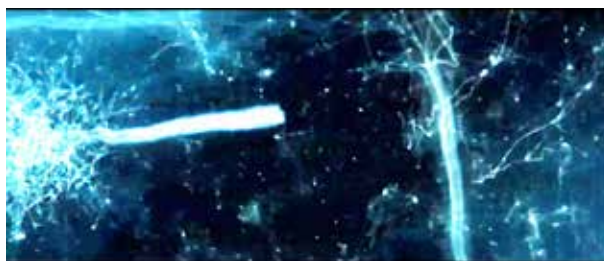
Neurones dans le cerveau photo

Cependant, je suis sûre de ne pas parler qu’en mon nom si je dis que malheureusement, je ne suis pas consciente de ces dons ni au quotidien ni même pas consciente du tout. Ce sont des dons virtuels pour user de termes modernes. Je sais qu’ils sont là, mais je ne peux pas les voir, ni les sentir ni les entendre ni bien identifier leur présence. Que puis-je faire pour combler le fossé entre ma conscience et ces dons pour que j’en fasse l’usage que voulait le Père ?