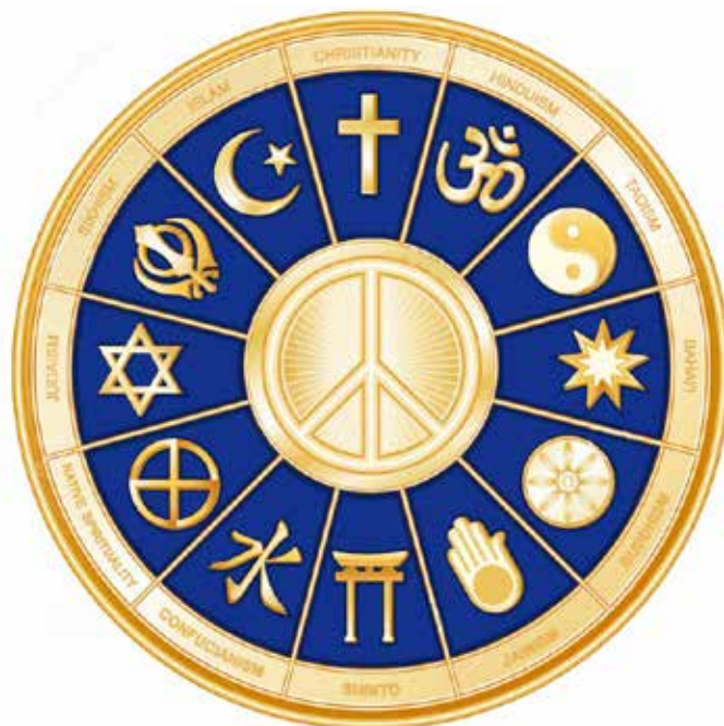
L'Unité dans la diversité religieuse, illustration

Dans l'esprit de cette déclaration et des objectifs du Parlement des religions du Monde regardons ce que dit le Livre