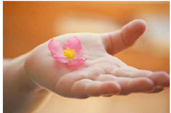
La main qui donne, photo

Juste avant notre sixième anniversaire, peut-être plus tôt, peut-être plus tard, nous avons tous pris notre première décision morale, le choix, fondé sur notre concept du bien et du mal, de faire ou de ne pas faire quelque chose, et cette décision a servi d'invitation et de signal pour dire que nous étions prêts à recevoir le plus grand don accordé par Dieu – une partie de lui-même. Le septième esprit-mental de sagesse a enregistré cette décision au travers de l'Esprit Créatif, puis dans l'esprit de gravité universel de l'Esprit Infini en présence du Maître Esprit du superunivers qui a envoyé cette information à Divinington où les Ajusteurs attendent leur affectation. Des renseignements détaillés concernant notre jeune âme ont été envoyés par les séraphins – notre héritage génétique, et les voies possibles de notre vie, y compris notre capacité intellectuelle et spirituelle (p. 1186). Cela pourrait même inclure une prédiction sur notre découverte du Livre d'Urantia comme partie de voyage spirituel. Un modèle fonctionnel de notre mental a alors été créé pour donner à l'Ajusteur quelque conseil sur la meilleure manière de travailler avec nous, puis après avoir passé la plus grande partie des 117 heures, 42 minutes et 7 secondes à s'enregistrer sur Uversa, notre Ajusteur est apparu dans notre mental ! (C'est une indication plutôt inquiétante de ce que la paperasse est un phénomène universel).