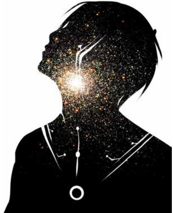
Ajustement à l'esprit intérieur, illustration.

Parce que le Père nous aime, il veut que nous lui ressemblions plus. C'est sa volonté que nous devenions plus semblables à Dieu. Ce n'est pas seulement ce qui est le meilleur pour nous, mais c'est aussi la seule façon pour nous de vraiment le connaître comme réalité vivante. Mais il ne peut pas le faire à notre place. Il nous a donné un Ajusteur de