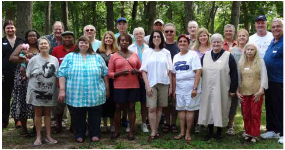
Quelques participants du GLMUA à la célébration de Jésus

G REATER LAKE MICHIGAN URANTIA Association (GLMUA) a accueilli notre événement annuel de la célébration du 2021 e anniversaire de Jésus, à Indiana Dunes State Park.