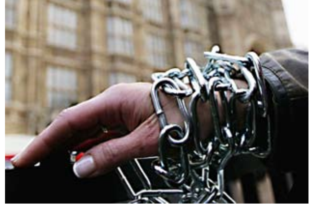
Tant que l'un d'entre nous est enchaîné, aucun d'entre nous n'est libre, photo

A U COURS DES DIX DERNIÈRES ANNÉES un petit comité de membres de l'AUI extrêmement dévoués a tranquillement procédé au travail de dissémination du Livre d'Urantia auprès de ceux qui se trouvent dans les lieux les plus sombres, à savoir les prisons de notre nation. Avant la formation de ce comité, la réponse aux lettres des prisonniers était un service que le personnel de la Fondation Urantia accomplissait comme partie des services de propagation auprès des lecteurs.