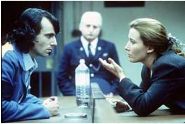
Chercher la rédemption, recevoir de la compassion.

du Livre d'Urantia concernant l'amour de notre Père était grandement empêchée du fait de manque de livres.