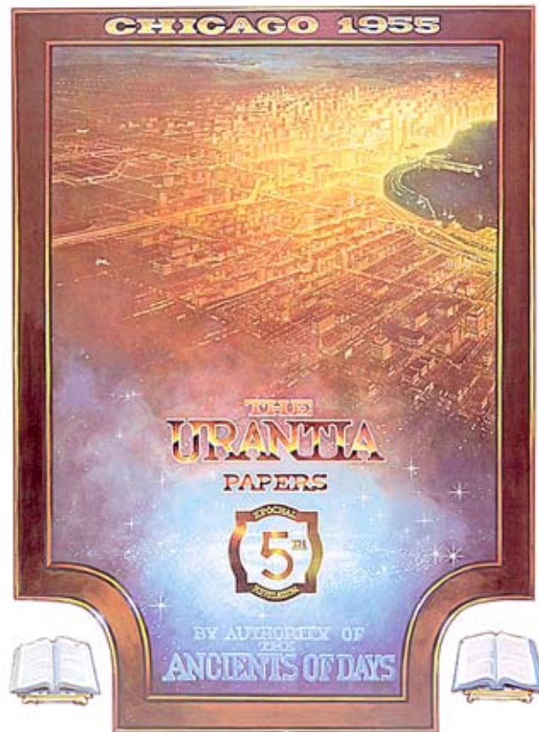
Cinquième Révélation d'Epoque poster

Il se trouva que l'approbation formelle vint d'une personnalité qui arriva sur Urantia le 21 aout 1951. C'était un Fils Melchizédek jusque-là inconnu et appelé Norson. Il fut présenté comme le Nouveau Régent du Prince Planétaire par intérim . Nous savons que le Prince Planétaire d'Urantia est le Christ Micaël qui a obtenu ce titre peu après son baptême en janvier 26. (p. 1512 et 1025) Il a remplacé Caligastia qui avait rejoint la rébellion de Lucifer. Micaël n'est pas