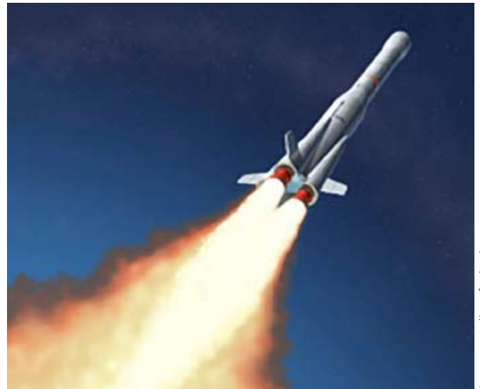
Lancement d'une fusée photo

Il est intéressant de noter que le Webb a six fois plus de capacité de collecter la lumière que ses prédécesseurs, il utilise dix-huit miroirs couvrant plus 6,5 mètres comparés aux 2,4 mètres de l'unique panneau de Hubble. Cette configuration d'ingénierie permettra à la NASA un meilleur contrôle pour maintenir un foyer super précis sur la lumière reçue et elle sera capable d'incrémenter de l'épaisseur d'un cheveu. En tapant sur un clavier, l'œil humain contempera des choses qu'il n'avait jamais vues auparavant. Cette perception de profondeur macroscopique a le potentiel de changer notre monde. 1