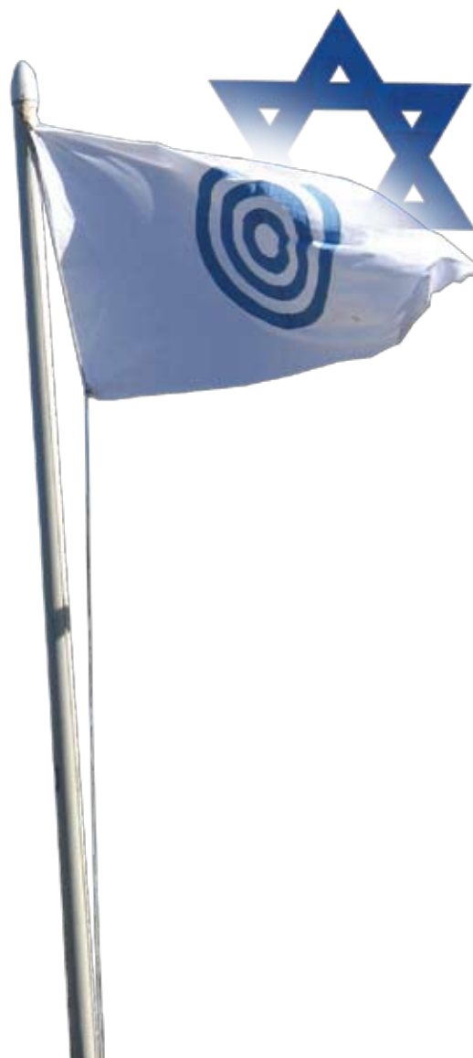
Combinaison de deux puissants symboles - photo

Nous avons commencé en tant que duo, et nous sommes maintenant un trio. Une équipe qui est à la fois minimale et complète. Pas étonnant que les triades soient si populaires dans l'univers des univers. Nos membres de l'équipe se complètent les uns les autres avec leurs compétences et leurs contributions.