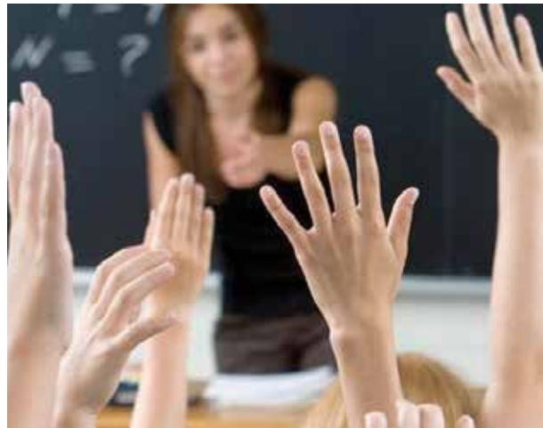
Le professeur, photo

Feu le philosophe espagnol Jose Luis Aranguren a dit dans son essai Ética (Éthique) : « Nous ne devrions jamais lutter de manière injuste, même contre l'injustice ». Et c'est absolument vrai. Nous ne pouvons pas faire usage de méthodes illicites pour transmettre ce qui est licite pour nous. Et l'usage de la force est, en vérité, une méthode illicite qui ne respecte pas du tout la personnalité unique de chacun de nos compagnons.