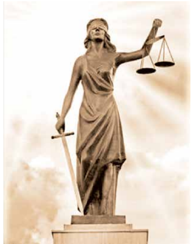
Statue de la Justice, un symbole d'impartialité

Ce sont nos décisions personnelles et collectives et les accidents du temps qui entraînent les conséquences avec lesquelles nous nous débattons. Les décisions personnelles sont celles sur lesquelles nous avons le plus de contrôle. Par exemple, nous pouvons décider de ne pas faire de l'exercice régulièrement, mais cela augmente grandement le risque de mal vieillir. Les décisions collectives constituent les orientations que nous prenons en tant que société et qui influencent le sort de chaque individu. Nous avons, généralement, moins de contrôle sur ces décisions. Par exemple, le pouvoir donné à l'industrie pétrolière par nos gouvernements amène des bouleversements qui se font sentir à l'échelle mondiale ; le réchauffement planétaire en est un