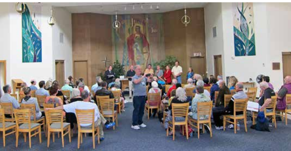
Cérémonie de fermeture lors du Symposium à Madison au Wisconsin

Du 31 octobre au 2 novembre 2014 À la Fondation Urantia, 533 Diversey Parkway, Chicago, É.U. Pour plus d'informations, visiter le http://urantia-association.org/the-soul/