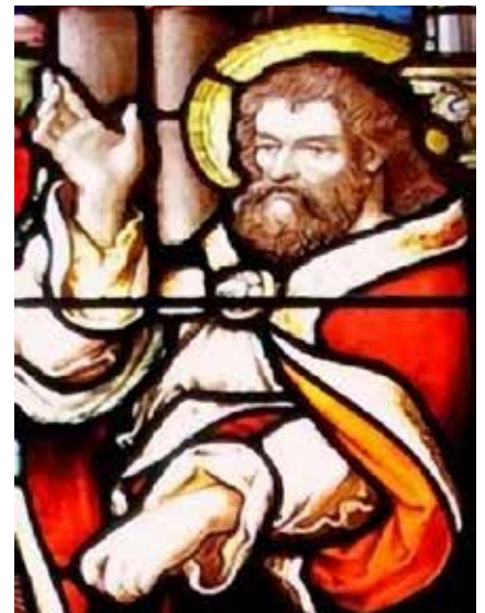
L'apôtre St-Marc, sur vitrail de la Chapelle de l'Université Bishop