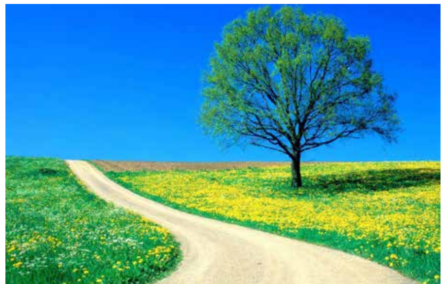
Je suis le chemin—www.wallfc.com—image

EN RÉFÉRENCE À L'EXTRAORDINAIRE Symposium UAI sur les Groupes d'Étude, permettez que je mentionne les points forts qui affecteront le plus mes enseignements et ma pratique. Tout d'abord, j'ai perçu d'une nouvelle façon une tension bénéfique entre (1) l'objectif de créer des milliers de groupes d'étude, tel qu'énoncé dans le Mandat de Publication et (2) les enseignements révélés pertinents à la méthode pour réaliser cet objectif. Si nous faisons honneur au mandat de Jésus à l'effet de ne pas entreprendre de montrer aux gens les beautés du temple avant de les avoir d'abord fait entrer dans le temple! [Fasc. 141:6.4, page1592.6]; et si nous faisons honneur à l'idéal de Jésus d'une vie harmonisée avec la vérité [Fasc. 155:1, page 1726], qui incite les autres à s'interroger à notre sujet, dans ces conditions, il peut sembler plus difficile de s'approcher du but de milliers de groupes d'étude. Mais je prédis que cette tension créative s'évanouira par le fait qu'avec Dieu, rien n'est impossible. Nous découvrirons une merveilleuse complémentarité entre le but énoncé dans le Mandat de Publication et les contraintes inhérentes à la méthode