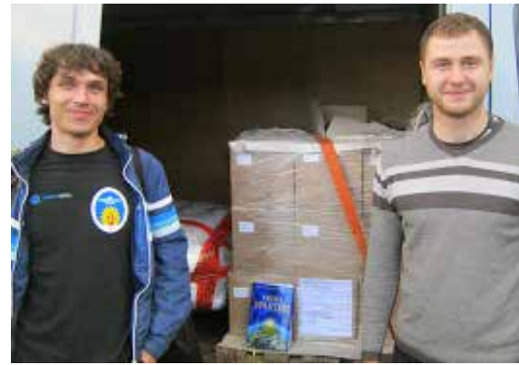
Réception de la livraison de 270 livres d'Urantia

Donc j'ai payé au complet tous les frais et ensuite, je pouvais estimer le coût d'un livre, qui était de 340 UAH (28,33$ US). En outre, pour les gens qui ont vraiment besoin d'un rabais, nous pouvons maintenant offrir jusqu'à 5$ US. Je pense que c'est un bon résultat. Le transport de livre pour un lecteur ukrainien coûte habituellement 2-3$ US,