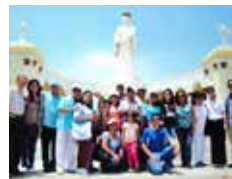
Groupe lors du tour de la ville.

tions, et par sympathie, gentillesse et leur côté spirituel, ils m'ont fait sentir comme un des leurs. Après avoir été quelques jours ensemble, je me suis senti comme si on se connaissait depuis de nombreuses années.