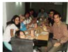
Dîner avec l'équipe de la conférence.