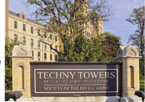
Lieu du congrès.