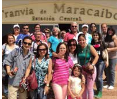
Photo de groupe à Maracaibo.