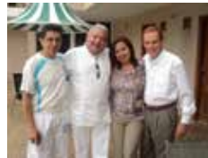
Amis partageant la fraternité.