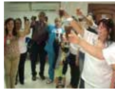
Cocktail de bienvenue.

Je me suis souvent demandé comment la Colombie, mon pays, était vu par d'autres; ainsi, ils ont volontiers répondu à mes ques-