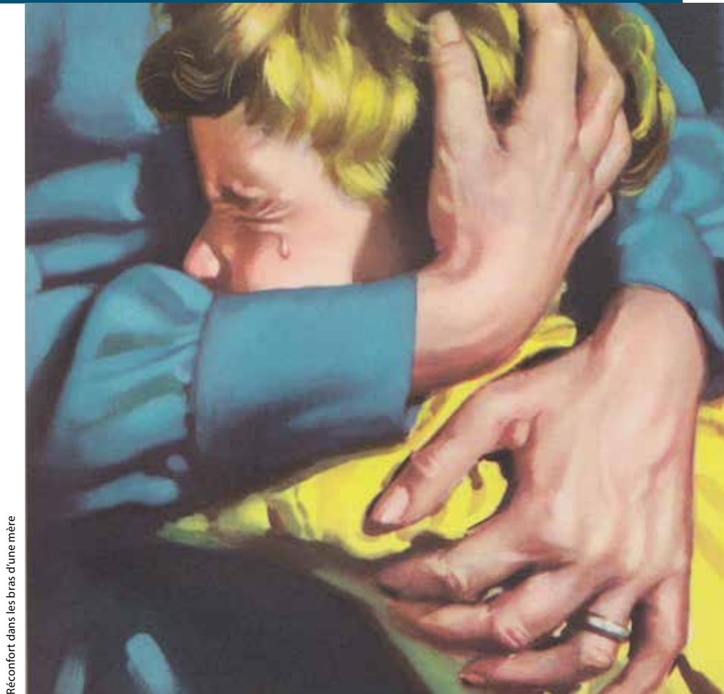
Réconfort dans les bras d'une mère