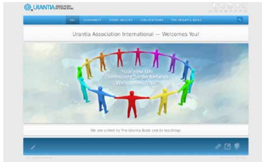
Sitio web de la AUI, página de bienvenida