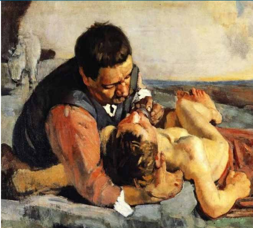
Toile intitulée, Le bon Samaritain