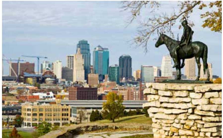
Un Indien surveillant le bas de la ville de Kansas City.

Toute véritable relation entre un mortel et d'autres personnes humaines ou divines est une fin en soi. Et une telle association avec la personnalité de La Déité est le but éternel de l'ascension de l'univers.