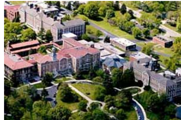
Lieu du Congrès—l'Université de St-Mary.

Avant le congrès, il y aura une rencontre pour les lecteurs de la jeune génération. Les activités sont toujours en train d'être organisées, mais elles vont aussi tourner autour du thème des "Relations" et aideront ces nouveaux lecteurs à se préparer à faciliter et à mener les discussions plus tard pendant le programme. Puisque les participants