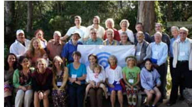
Participants au groupe

LE CONGRÈS ANNUEL 2012 ANZURA des lecteurs du Livre d'Urantia s'est déroulé récemment à Alexandra Headland sur Queensland Sunshine Coast, en Australie du 14 au 17 septembre. À mon avis, ce fut un succès retentissant.