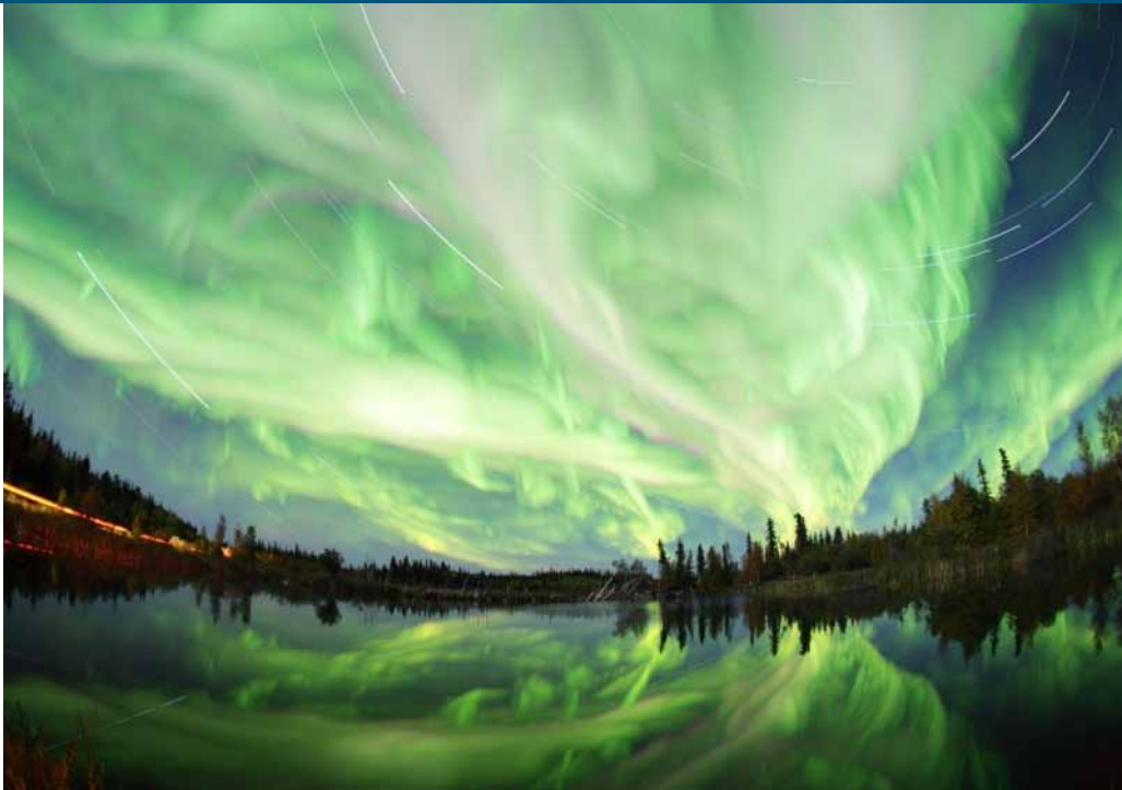
Photo d'une aurore boréale