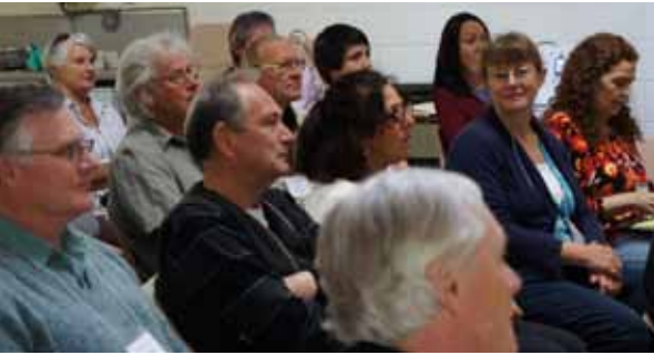
Les participants au Congrès d'ANZURA