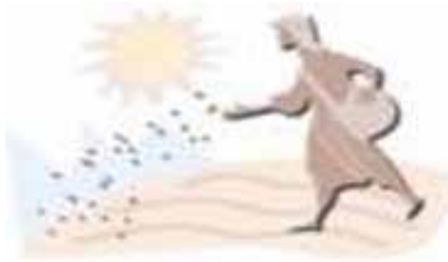
De la parabole des semeurs