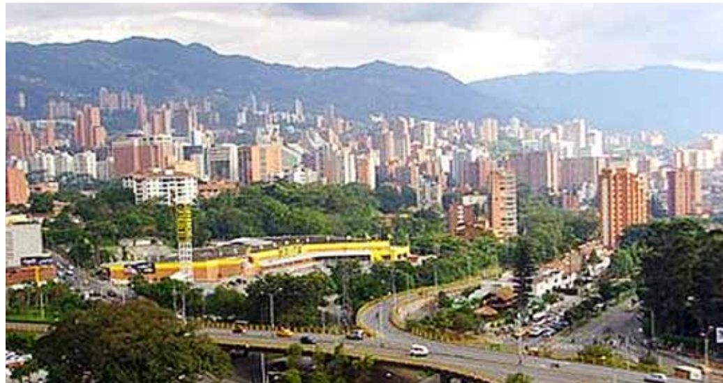
Vue de Medellín, seconde plus grande ville en Colombie

P RENDRE CONSCIENCE DE LA PLACE qu'occupe « Le Livre d'Urantia » dans notre vie, c'est de prendre conscience de la place qu'occupe le Père, l'Ajusteur.