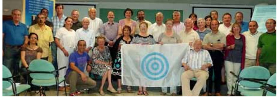
Photo de groupe