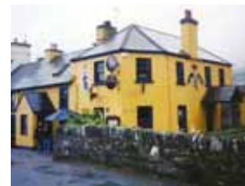
Le pub Piper Blind à Caherdaniel