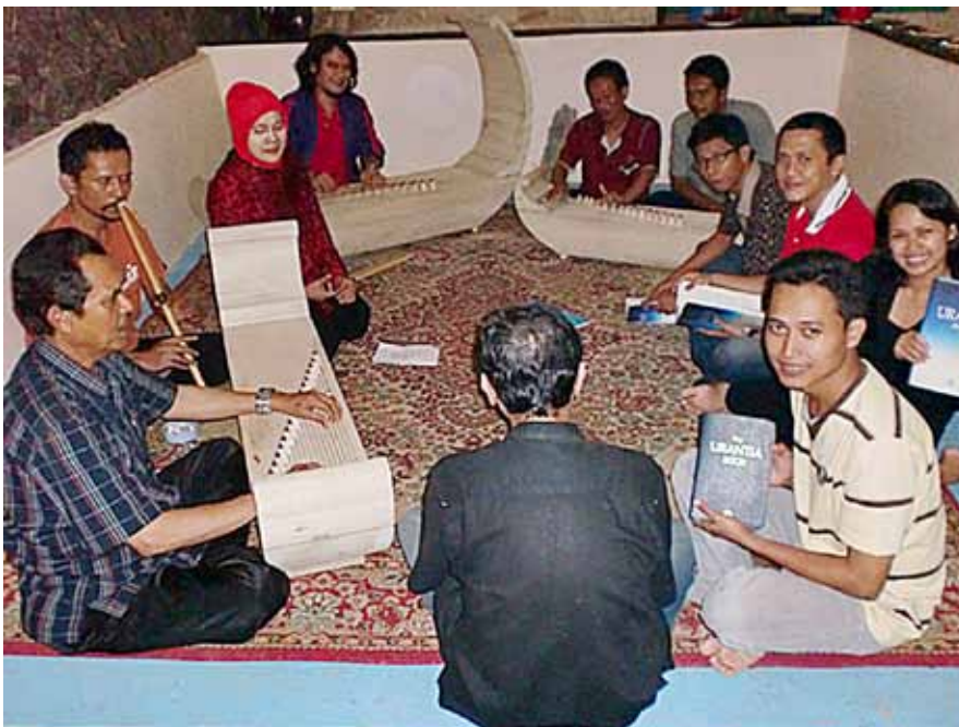
El grupo de estudio reunido

P RANA CIPTA URANTIA INDONESIA es el grupo de estudio de El libro de Urantia. Nuestra actividad consiste en dar ministerio a los miembros para aprender más profundamente acerca del Ajustador del Pensamiento.