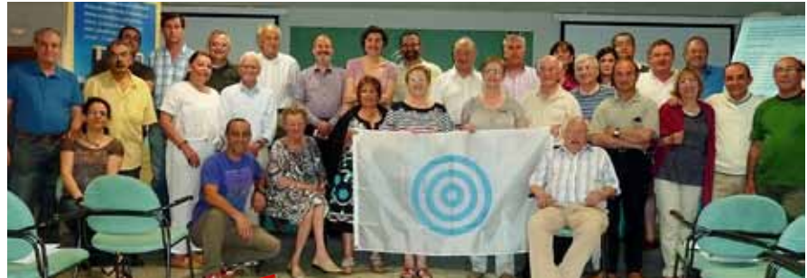
Todo el grupo reunido