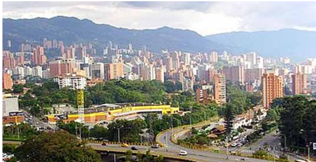
Vista de Medellín, la segunda ciudad en tamaño de Colombia.

LA CONCIENCIA DEL VALOR DE EL libro de Urantia en nuestra vida es concomitante con la conciencia de la presencia del Padre dentro de nosotros, el espíritu residente del Ajustador del Pensamiento.