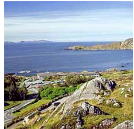
Vista pintoresca de Caherdaniel, situada en la costa del Condado de Kerry, al suroeste de Irlanda