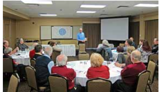
Reunión general de la Asociación Urantia de Québec, 2012