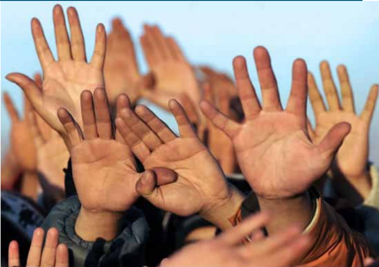
Alcanzar la verdad, foto.