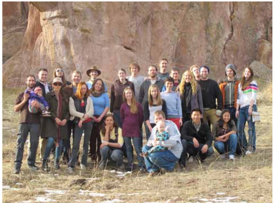
Grupo de la conferencia de la generación joven