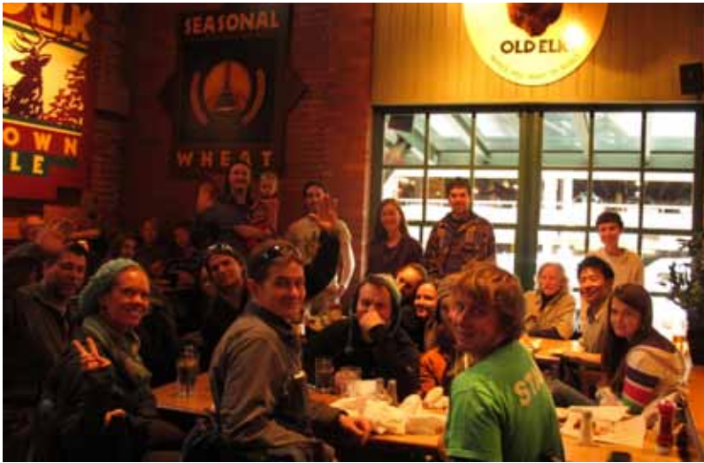
Todo el grupo tomando juntos una cerveza