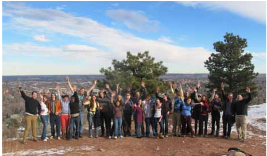
Miembros de la juventud de Urantia preparándose para comenzar la conferencia

Fue increíble reconectar con viejos amigos, así como conocer a varios estudiantes jóvenes y dedicados que se sentían emocionados al participar por primera vez en algo de esta naturaleza. Otros participantes eran nuevos para el LU, y fue esperanzador ver su entusiasmo y lo inspirador que les pareció el encuentro. Otro punto destacado para mí fue la magia que trajeron los pequeños que