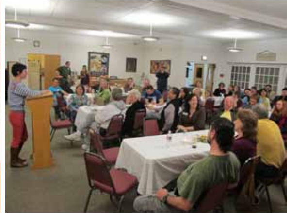
Conferencia de la juventud de Urantia