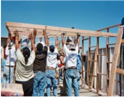
Muchas manos alivian la carga.