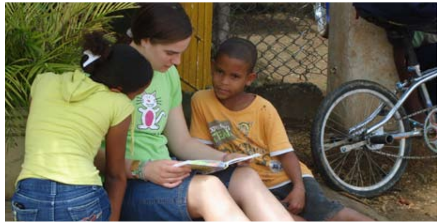
Estudiante universitaria lee a unos niños en República Dominicana.

¡No os engaños! Existe en las enseñanzas de Jesús una naturaleza eterna que no les permitirá permanecer estériles para siempre en el corazón de los hombres inteligentes. El reino, tal como Jesús lo concebía, ha fracasado en gran parte en la Tierra; por ahora, una iglesia exterior ha tomado su lugar. Pero deberíais comprender que esta iglesia es solamente el estado larvario del frustrado reino espiritual, que esta iglesia lo transportará a través de la presente era material y lo llevará hasta una dispensación más espiritual en la que las enseñanzas del Maestro gozarán de una mayor oportunidad para desarrollarse. La iglesia llamada cristiana se convierte así en el capullo donde duerme actualmente el concepto que Jesús tenía del reino. El reino de la fraternidad divina está todavía vivo, y saldrá sin duda finalmente de su largo letargo, con la