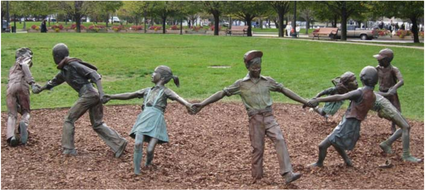
Niños jugando, escultura, Navy Pier Park, Chicago (EEUU)

el primer artículo para el 1 de febrero de 2011.