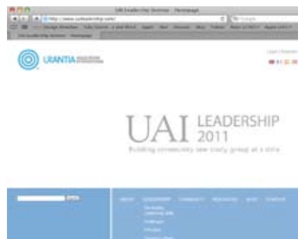
Página web del Liderazgo.

Cada grupo local y nacional de lectores podría tener diferentes respuestas a estas preguntas. Pero una cosa es cierta: en cada