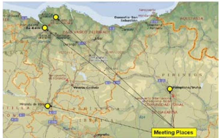
Grupo de Estudio del Area Norte

S ABEMOS LO QUE ES ser un lector solitario; lo hemos sido durante varios años. Y ahora que tenemos un grupo de estudio vemos la gran diferencia; es como conducir mirando sólo la monótona carretera, o viajar disfrutando de un paisaje espectacular y luminoso..