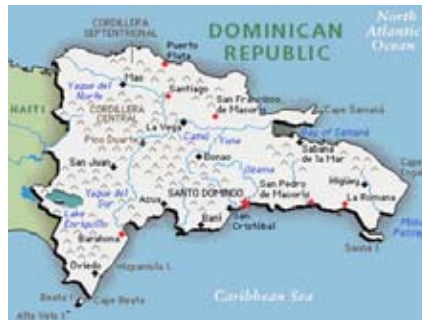
Un país de la Isla Española, parte del archipiélago de las Antillas Mayores, en el Caribe.

Inmediatamente abrí el índice, después fui al Prólogo y, en ese rápido vistazo, ya supe que si comenzaba a leer El libro de Urantia no podría parar hasta terminarlo. Mi hermano leyó algunos párrafos y el índice y me dijo: "Comprémoslo". El dueño de la tienda, que nos observaba con atención y curiosidad, dijo: "Creo que tengo uno de esos libros en español en el almacén". Solo pudimos comprar