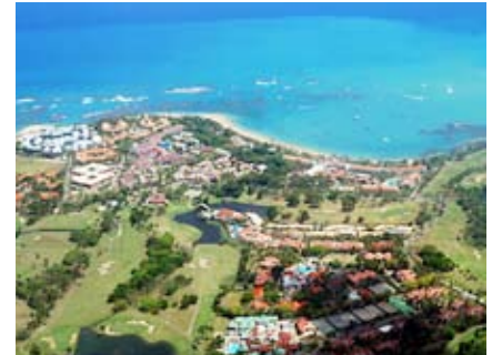
Vista aérea de Santo Domingo, la capital, que muestra el paisaje tropical que atrae a tantos visitantes.

un libro, así que decidimos que mi hermano lo leería primero. Yo podía leer en esos breves momentos en los que mi hermano lo dejaba. Las historias y las respuestas del libro me llevaron a crear una nueva perspectiva cósmica y mi mente comenzó a expandirse. La muerte inminente de mi padre perdió su aspecto trágico y las conversaciones con él se hicieron más placenteras y profundas.