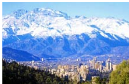
Santiago de Chile con la Cordillera de los Andes cubierta de nieve al fondo..

después de divorciarnos de nuestras respectivas parejas. Desde entonces hemos estado juntos y felices compartiendo nuestra vida.