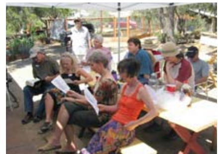
En reflexión profunda