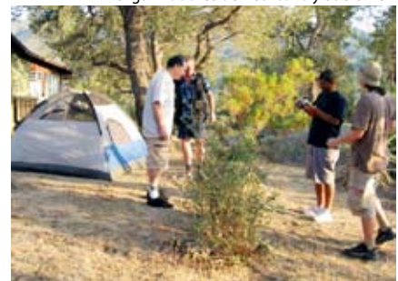
Acampada en el desierto