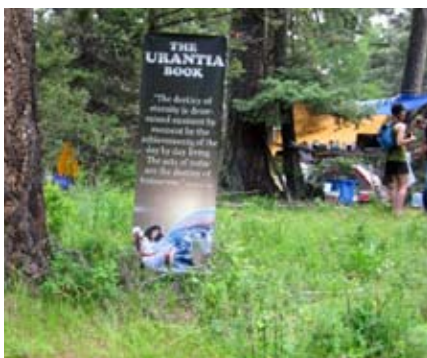
Pancarta del 'Campamento Urantia' con una cita del Libro