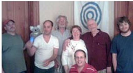
Groupe d'étude de Great Plains