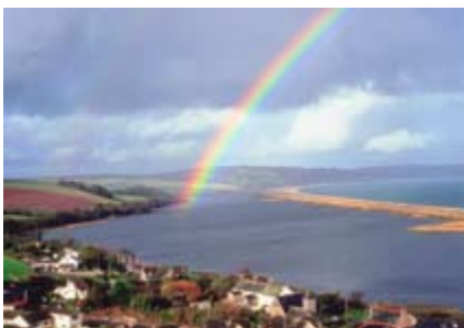
Arc en ciel à Devon, Angleterre