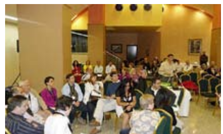
Participants à une rencontre d'étude