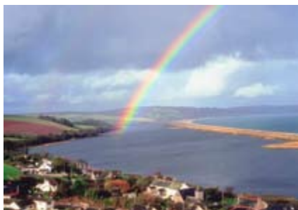
Arc en ciel à Devon, Angleterre