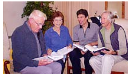
Groupe d'étude de Canberra