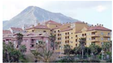
Hôtel Vistamar, où s'est tenu le Congrès