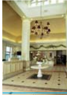
Lobby du Hilton Garden Inn