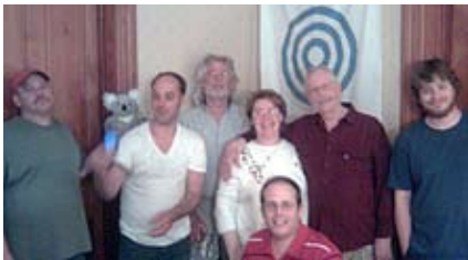
Groupe d'étude de Great Plains