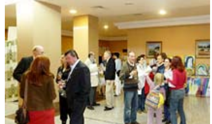
Cocktail de bienvenue dans le salon