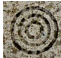
Tuile avec les cercles concentriques sur un trottoir à Malaga

L'année suivante, en 2007, le Conseil des représentants de l'AUI votait à l'effet que le congrès international se tiendrait dorénavant à tous les trois ans plutôt qu'à tous les deux ans. Ce qui amenait la tenue de cet événement à l'année 2009. Nous avons