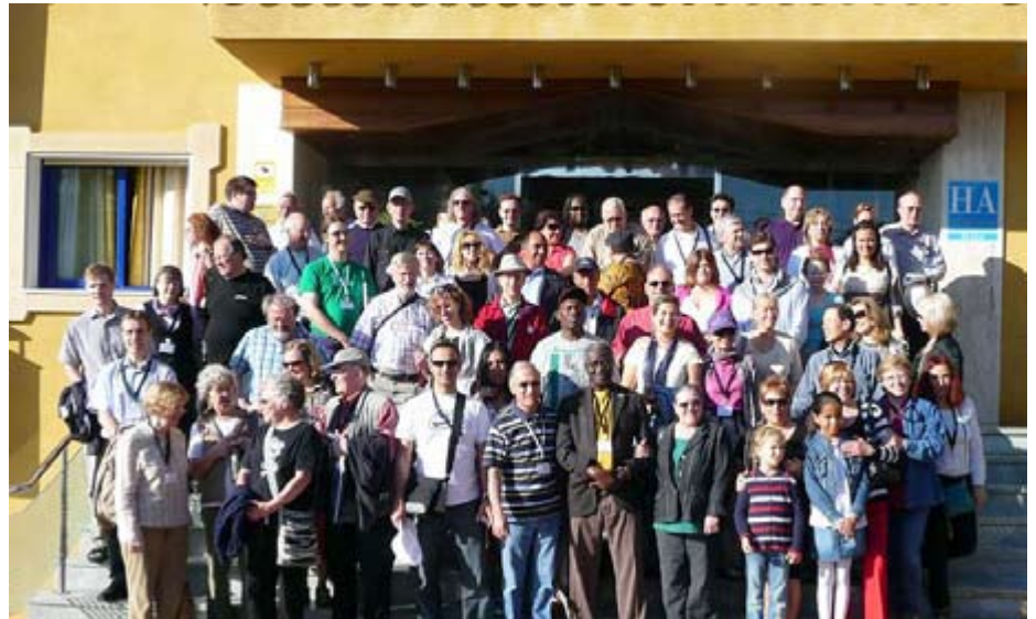
Photo de groupe au Congrès de l'Association Urantia international à Malaga en Espagne

L'organisation du dernier congrès fut un travail de longue haleine pour l'Association Urantia d'Espagne. Ce qui n'était qu'une idée en 2005 est devenu un projet en 2007 et n'est plus aujourd'hui qu'un très bon souvenir.