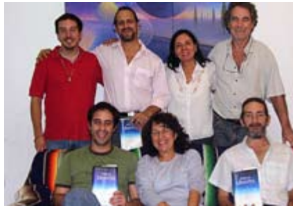
Groupe d'étude de l'Argentine

Ils se sont réunis le 23 mai et ont lu le fascicule 100. Ils ont vécu une belle expérience avec le sentiment bienveillant que plusieurs autres lecteurs à travers le monde étudiaient le même fascicule ce même weekend. ☐