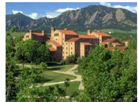
Universidad de Colorado – Boulder

Para más información, visiten el sitio web de la UAUS www.urantiausa.com , nuestra página de Myspace www.myspace.com/urantiaconferencckc o inscribise en línea en https://www.regonline.com/63367_694721J