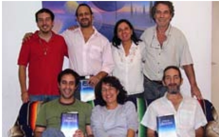
Grupo de estudio de Argentina

loso al saber que muchos otros lectores de todo el mundo estaban estudiando también el mismo documento ese mismo fin de semana. □