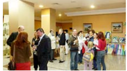
Cóctel de bienvenida en el salón