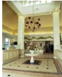
Lugar: el Hilton Garden Inn

ESTUDIO DE OTOÑO DE 2009 Del 25 al 27 de septiembre