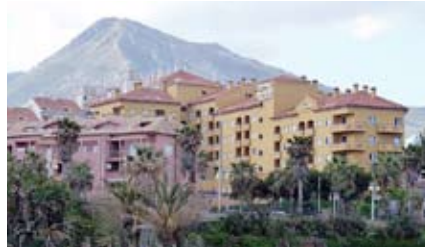
Hotel Vistamar – lugar de la conferencia

T ENDIENDO PUENTES™ EN MÁLAGA fue mi primera conferencia internacional y me lo pasé maravillosamente bien conociendo a lectores de todo el mundo