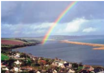
Arco Iris sobre Devon, Inglaterra

LA ASOCIACIÓN URANTIA DEL Reino Unido e Irlanda les da una calurosa bienvenida a su stand en la próxima Quest Natural Health Show, que se celebrará en Newton Abbott Racecours, en el glorioso Devon (Inglaterra), del 2 al 5 de julio de 2009.