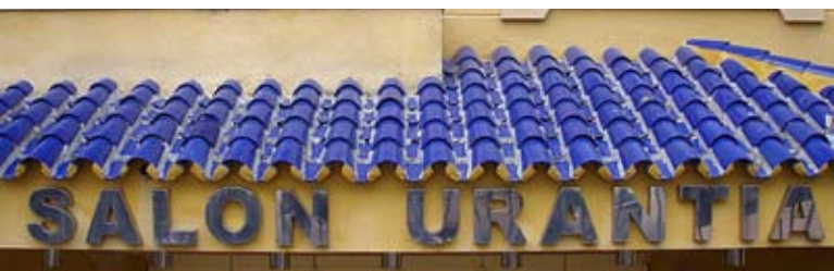
Señal permanente en el edificio del Hotel Vistamar (el director es lector)