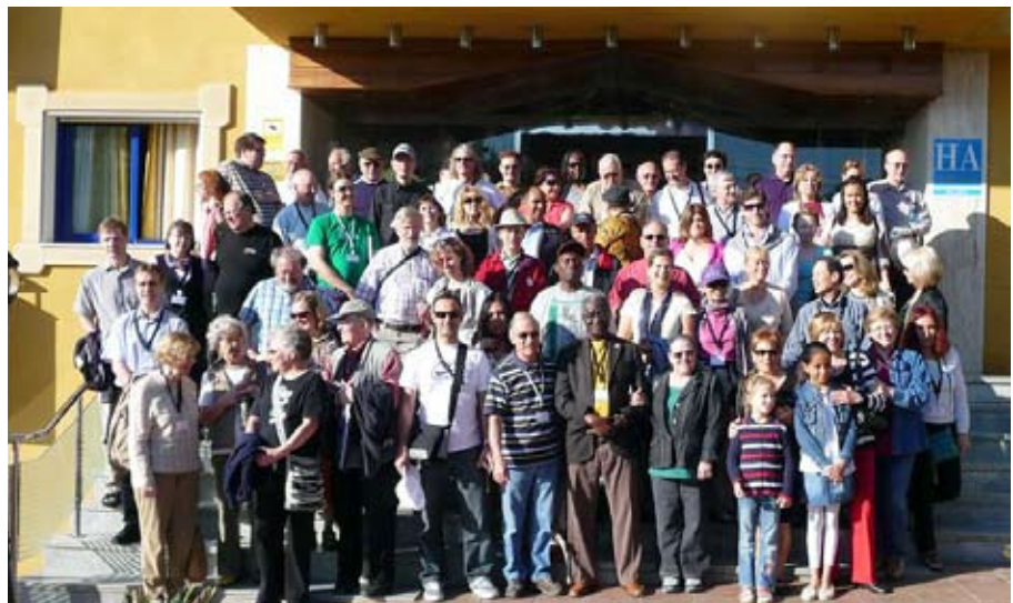
Foto de grupo de los que fueron a "tender puentes" - asistentes a la Conferencia Internacional de la AUI en Málaga, España

España es un país muy turístico que recibe varios millones de visitas al año, así que hay alojamiento de todas clases y eso no iba a suponer un problema. Pero queríamos un sitio donde los lectores del libro se sintieran a gusto, y parecía que las grandes ciudades como Madrid o Barcelona no iban a ofrecer ese ambiente. En septiembre, aprovechando las vacaciones de verano, fui con mi familia a Málaga a visitar a unos cuantos amigos lectores. Justo ese día