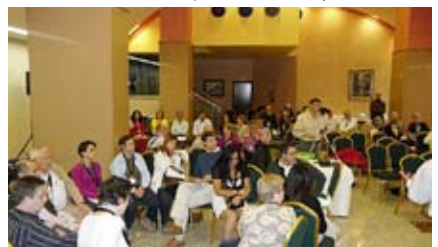
Asistentes disfrutando de una sesión de grupo de estudio