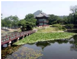
Vistas del bello paisaje coreano.