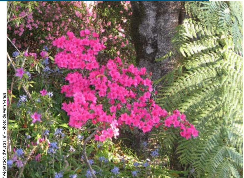
"Végétation d'Australie"