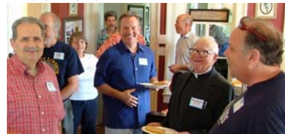
Étudiants du Livre d'Urantia en Ohio célébrant la fête de Jésus