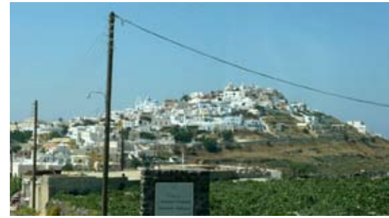
Vue de Caldera de la colline de Santorini

Plusieurs lecteurs avaient préparé une «suite des événements» de l'effusion de Micaël sur la planète 606. Ce travail exigeant nous a donné un petit aperçu de la difficulté que les médians ont pu avoir à rédiger l'histoire de la vie de Jésus. Nous avons lu jusqu'à la 29e année et avons décidé de faire une pause pour le repas. Ce repas partage précédé du sacrement a été parfait