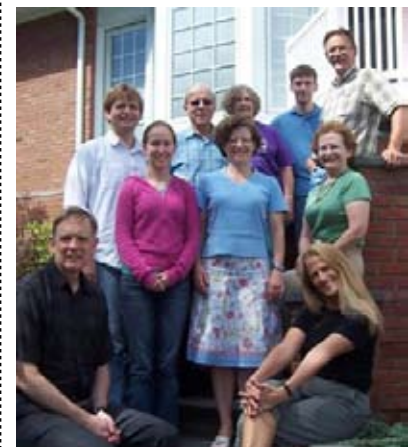
Un groupe uni profitant de cet instant