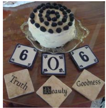
Très beau gâteau de fête du 2014e anniversaire de Jésus offert par

S AMEDI 16 AOÛT DERNIER AU PARC HOPKINTON dans le Massachusetts, l'Association Urantia de la Nouvelle - Angleterre en collaboration avec des lecteurs du Connecticut, se sont réunis pour célébrer la fête du Maître. Vingt personnes se sont présentées.