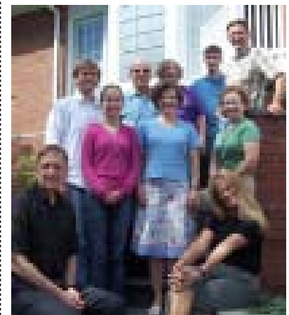
Un grupo unido disfrutando del momento