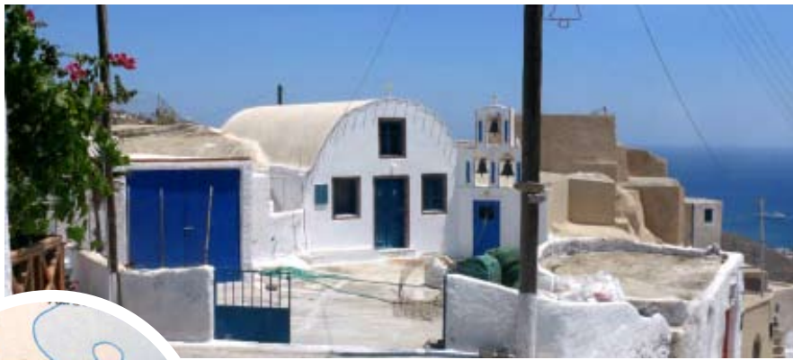
Casa de Santorini donde estuvo Pio