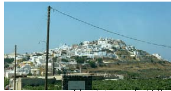
Colina de Santorini con vistas a la Caldera.

606. Fue una dura tarea pero ahora hemos vislumbrado el difícil trabajo que los intermedios tuvieron que hacer al escribir la historia de la vida de Jesús. Todo parecía muy importante y digno de mención. Estuvimos haciéndolo hasta sus 29 años, cuando nos asaltó el hambre. Así que hicimos una pausa para cenar que fue precedida por el sacramento. No se preasignaron platos específicos pero conseguimos que todas las