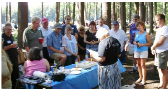
Los lectores de Nueva Inglaterra en el parque Hopkinton de Massachussets.

El encuentro se celebró en el Parque Hopkinton de Massachussets. Este fue un evento social con buena comida y barbacoa, que terminó con un pastel con la instrucción del Maestro: "Amaos los unos a los otros".