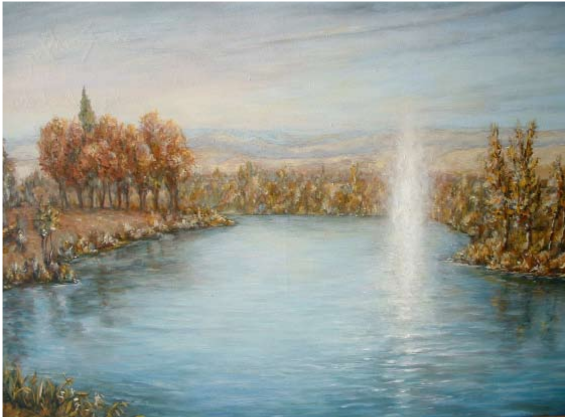
"Acontecimiento en el río Jordán" pintura al óleo de Carlos Rubinsky