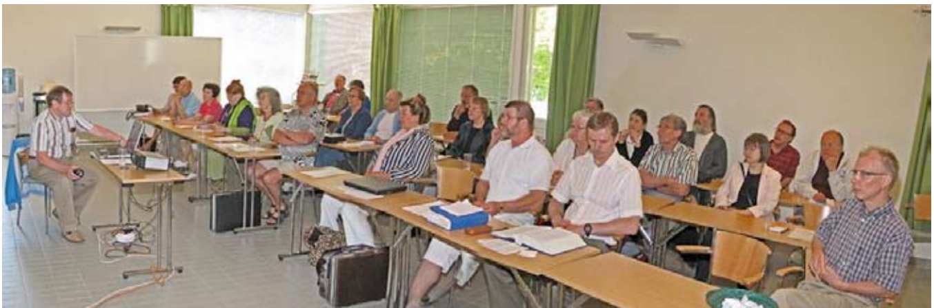
Sesión en el aula durante la Conferencia de verano 2008