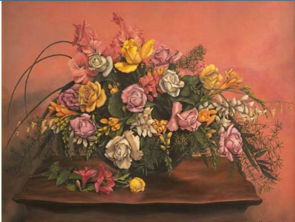
"Rosas Maui" pintado por Tonia Baney