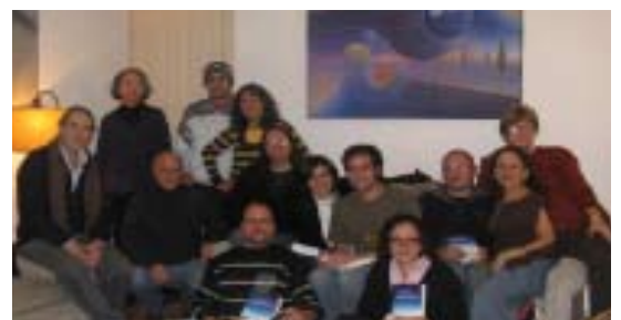
El Grupo de Estudio de Buenos Aires – Argentina