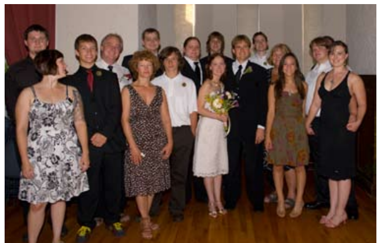
Amigos reunidos para celebrar con la feliz pareja