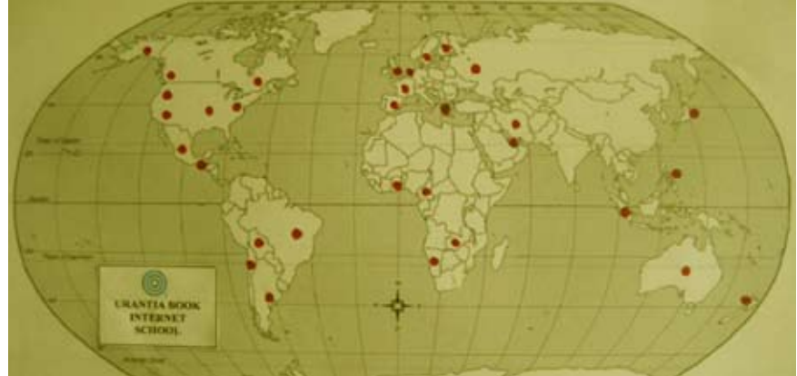
El aula global- localización de nuestros estudiantes