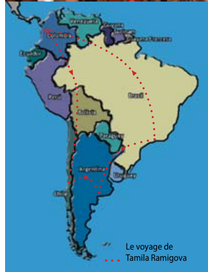
Le voyage de Tamila Ramigova