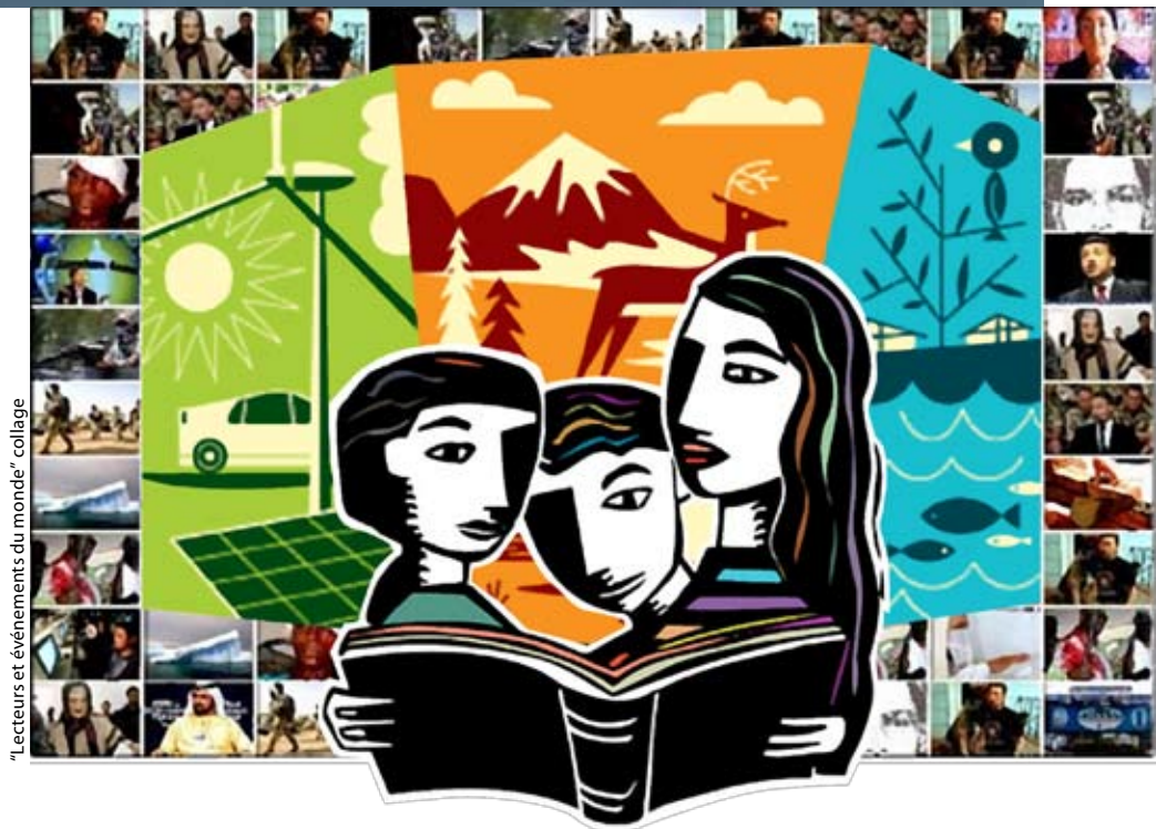
“Lecteurs et événements du monde” collage