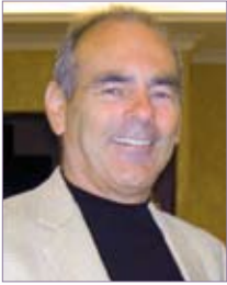
Chers amis de l'AUI,