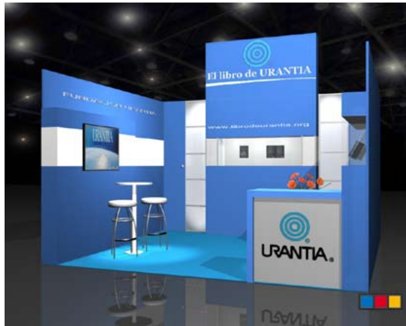
Maquette proposée pour le kiosque du Salon du livre à Buenos Aires, Argentine

Imaginez – ne pas se satisfaire seulement de parler d'unité, mais s'unir afin d'accomplir un projet important.