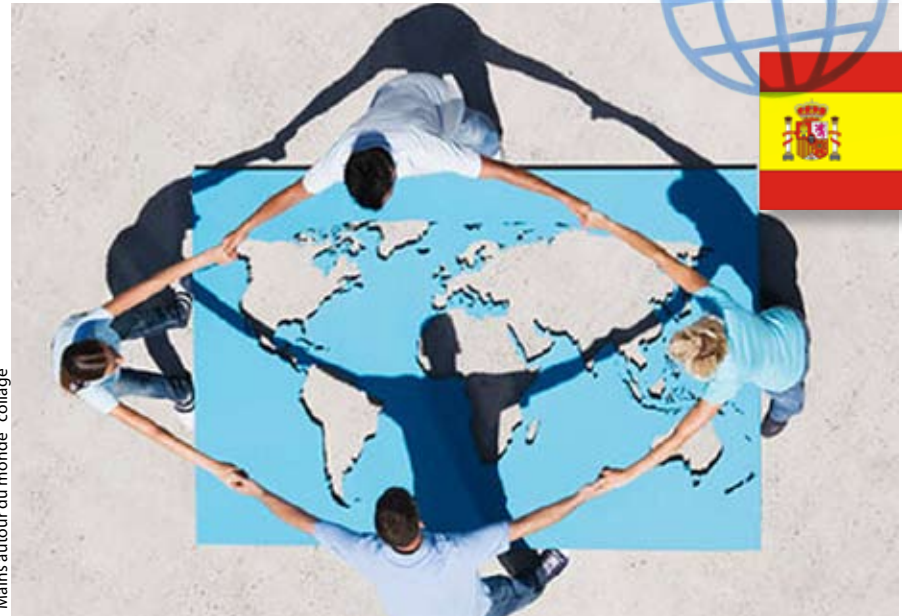
"Mains autour du monde" collage