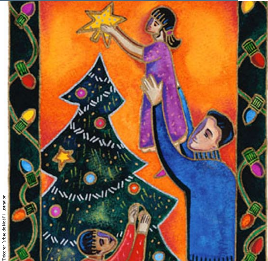
"Décorer l'arbre de Noël" illustration