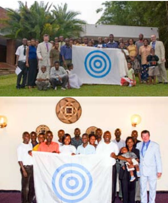
Cérémonies d'accréditation, la première photo est à Lilongwe au Malawi et la deuxième est à Ndola en Zambie

Président du comité des membres de l'AUI