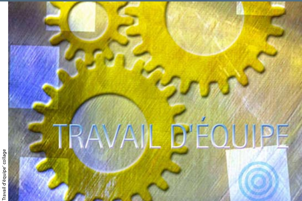
Travail d'équipe: collage