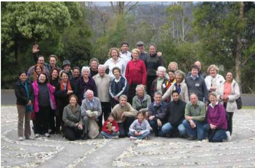
Les participants d'Australie, de la Nouvelle-Zélande et des États-Unis se réunissent au centre du labyrinthe au Edmund Rice Centre à Melbourne, Australie