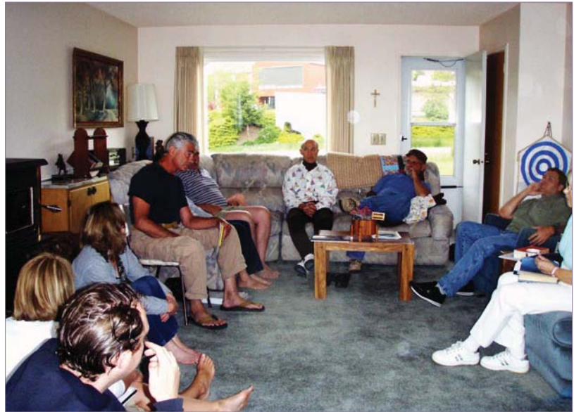
Photo de groupe. Pour plus de photos, voir: http://www.urantia-uai.org/photos/index.html

sur les prairies en contre-bas, fut pendant onze années consécutives pour la fin de semaine du jour du Souvenir, le lieu de rassemblement de l'Association Urantia de l'Idaho.