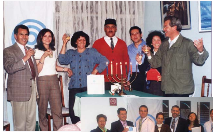
Photo de groupe no. 1 en haut Photo de groupe no. 2 à droite