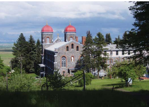
Monastère Ste-Gertrude à Cottonwood, Idaho

Au bas de la colline, à une distance d'un jet de pierre du monastère et à l'intersection d'une route de campagne, se trouve une vieille maison de ferme convertie en un petit centre de conférence. Il comprend une demi-douzaine de salles de bain, une très grande pièce de séjour, une cuisine fonctionnelle et peut accommoder une vingtaine de personnes. Cette vieille habitation avec sa vue imprenable