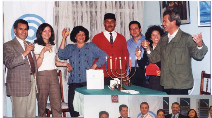
Foto de grupo 1, arriba Foto de grupo 2, derecha