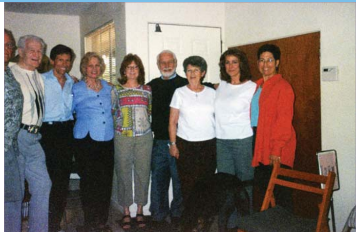
Photo de groupe d'Arizona

La base de cette maîtrise réside dans un esprit équilibré, logé dans un corps aux habitudes