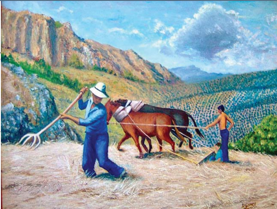
"La saison de la moisson" Peinture par Demetrio Gomez (Madrid, Espagne)