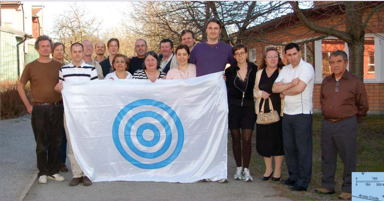
Photo de groupe. Encore plus de photos de l'inauguration au http://www.urantia-uai.org/photos/index.html