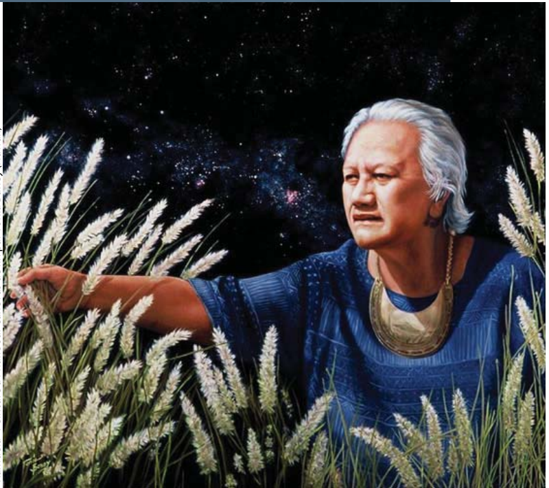
"Kamuēla" Peinture à l'huile sur canevas de lin par Tonia Baney (Hawaïi)