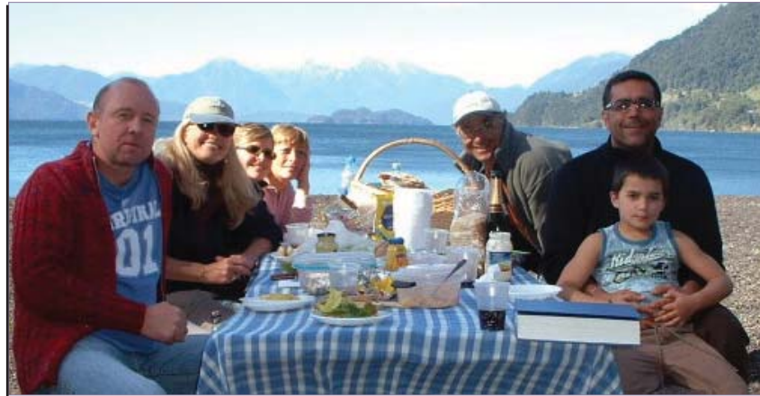
Pique-nique à Lago Todos Los Santos (Lac des Saints)