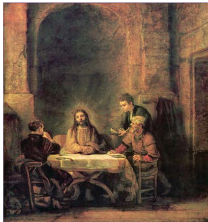
"Dîner à Emmaüs" Rembrandt van Rijn, 1648

"Je ne manquerai de rien. Il me fait reposer dans de verts pâturages, Il me dirige près des eaux paisibles. Il restaure mon âme, Il me conduit dans les sentiers de la justice, à cause de son nom. Quand je marche dans la vallée de l'ombre de la mort, Je ne crains aucun mal, car tu es avec moi: Ta houlette et ton bâton me