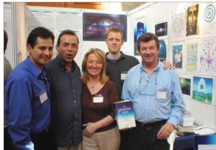
Foire du livre à Londres, R.U.

Le Comité de dissémination a également créé un projet de Foire du livre, en réponse à un de ses mandats inclus dans la Charte. Ce projet de l'AU est offert conjointement avec le service au lecteur de la Fondation Urantia. Ça encourage des membres à donner des présentations dans des lieux appropriés, par exemple dans les conventions de bibliothécaires et dans les expositions de livre. Un ensemble comprenant