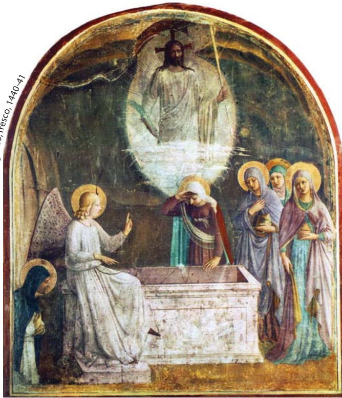
“Résurrection du Christ et les femmes au tombeau” Fra Angelico, fresco, 1440-41