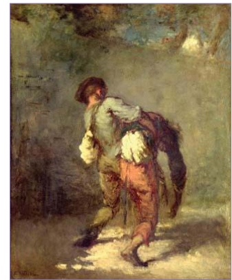
«Le Bon Samaritain» Jean-François Millet, 1846