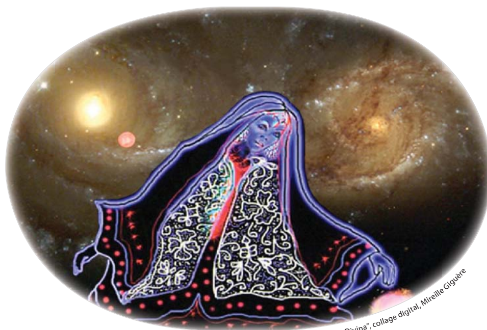
"Ministra Divina", collage digital, Mireille Giguère

ASOCIACIÓN URANTIA INTERNACIONAL ■ HTTP://URANTIA-UAI.ORG ■ EDICIÓN ESPAÑOLA ■ Nº 22 ■ MARZO DE 2007