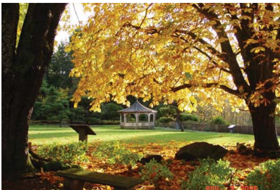
Vista desde el Centro Dumas Bay Retreat

Organizada por la Asociación Urantia del Estado de Washington en el Centro Dumas Bay Retreat