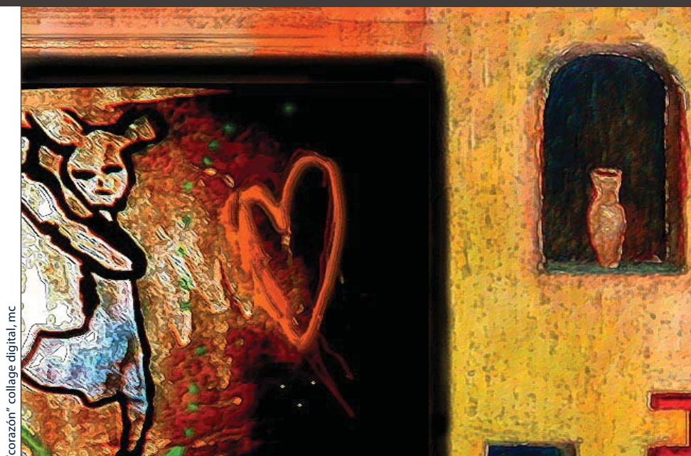
"corazón" collage digital, mc

ASOCIACIÓN URANTIA INTERNACIONAL ■ HTTP://URANTIA-UAI.ORG ■ EDICIÓN ESPAÑOLA ■ Nº 21 ■ FEBRERO DE 2007