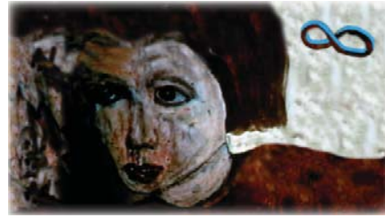
“Rostro” collage digital, mc

—Comité de la Conferencia UAUS 2007 Asociación URANTIA del Estado de Washington “Uni Diversity” udiversity@gmail.com