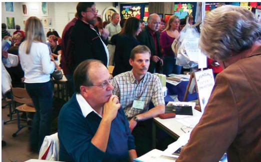
Deux expositions: en haut, l'exposition de "Je Suis" en bas, exposition de "L'Esprit et la Connaissance"

RAIMO ALA-HYNNILÄ gadonia@kolumbus.fi Suomen Urantia-seura ry.