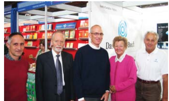
Présentation du Livre d'Urantia dans la plus grande foire du livre dans le secteur de langue allemande en Allemagne