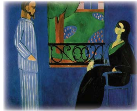
“La Conversation” Henri Matisse, 1909