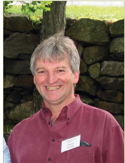
Claude en retraite à Lafontaine, Québec

J'ai personnellement trouvé dans la lecture de ce livre un guide de vie, un mode d'emploi, une philosophie à toute