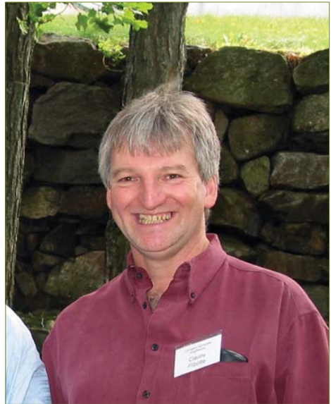
Claude en un retiro en Lafontaine, Québec

Por eso me dirijo a ustedes, futuros lectores. Si su curiosidad y su sed de conocimiento son tan grandes como los míos, les invito cordialmente a estudiar este libro. Y recuerden que éste constituye sólo el primer paso que les llevará directamente al Paraíso, la fuente de todas las cosas y la residencia eterna de nuestro Padre, el Padre de todos. ¡Buen viaje! □