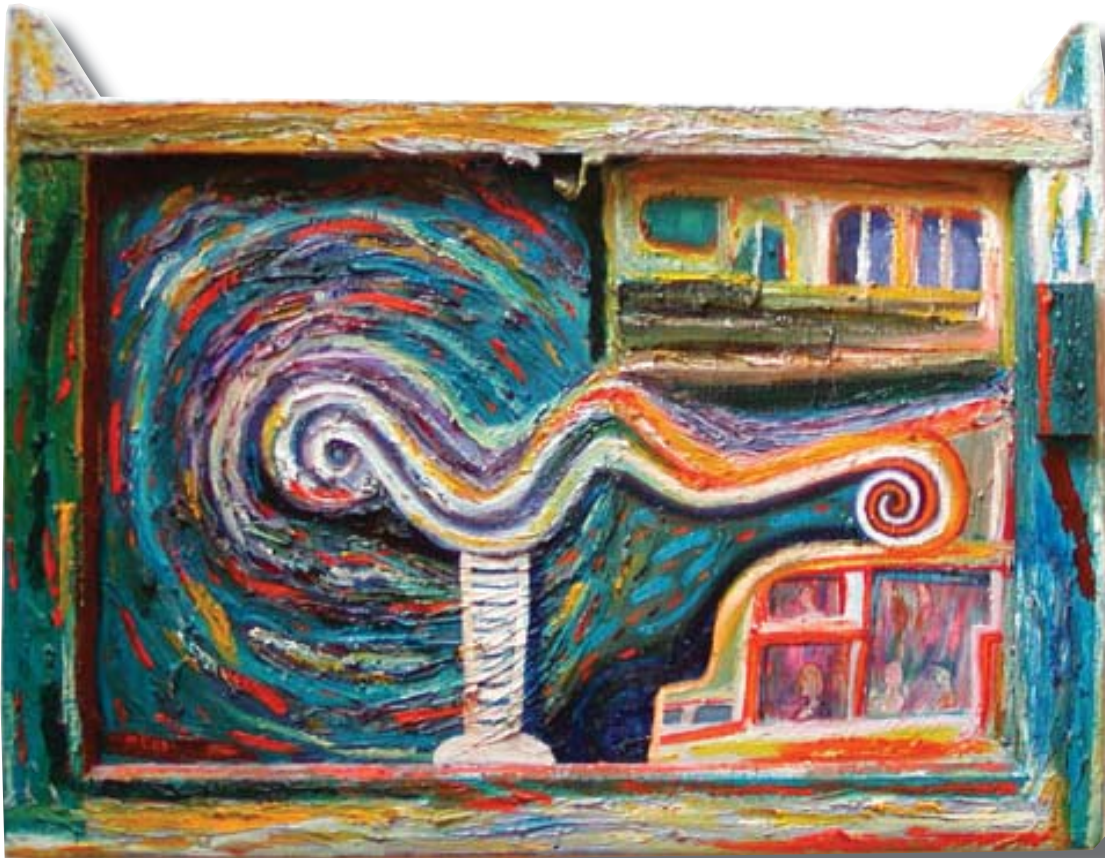
"Pasajeros", óleo sobre ventana, pintura de M. Caoile