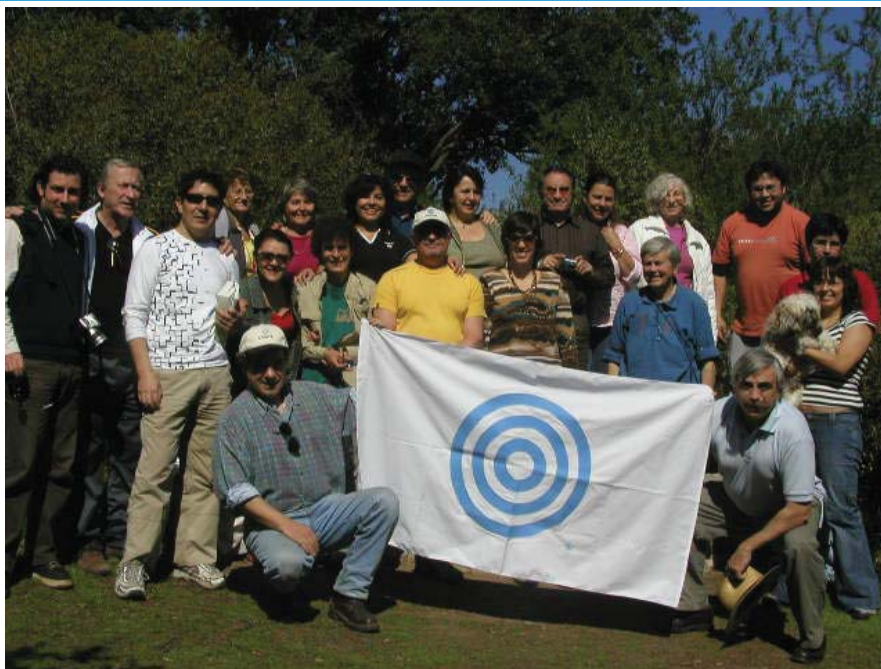
Photo de groupe. Pour plus de photos, allez au http://www.urantia-uai.org/photos/