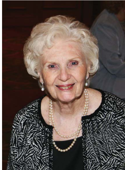
Dorothy à Chicago

Quoi qu'il en soit, en 1968, l'année a commencé par beaucoup de stress et d'incertitude. Mon mari étant malade depuis un certain temps, il était souvent hospitalisé et sans-travail. Sa maladie était très sérieuse et débilitante, et le futur très incertain. J'étais remplie de beaucoup de tristesse, de crainte et de souci. Vers cette période-là, ma mère a commencé à me parler d'un livre qu'elle avait trouvé et qui contenait toutes les réponses; un livre qui avait été écrit par les anges et qui parlait de tout, au sujet de Jésus et de l'univers entier.