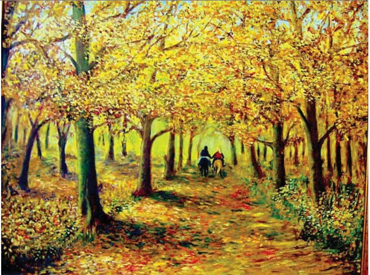
"Automne" Huile sur canevas par Demetrio Gómez (Madrid, Espagne)