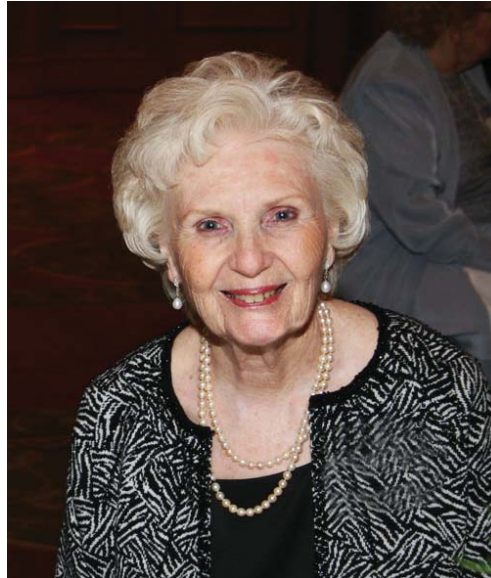
Dorothy en Chicago

Pero volvamos a marzo de 1968. Ese año comenzó con mucho estrés e incertidumbre. Mi marido había estado enfermo durante un tiempo, entraba y salía del hospital y no podía trabajar. Su enfermedad era muy seria y debilitadora, y como el futuro era muy incierto yo sentía mucha tristeza, miedo y preocupación. Por aquel tiempo mi madre empezó a hablarme de un libro que había encontrado y que contenía todas las respuestas; un libro que había sido escrito por los ángeles y que lo contaba todo sobre Jesús y el universo. Ella seguía insistiéndome en que consiguiera el libro, pero cuanto más insistía ella