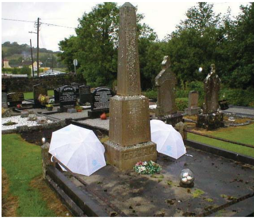
Lápida de familia Graham

final de nuestro viaje de dos semanas por la Isla Esmeralda.