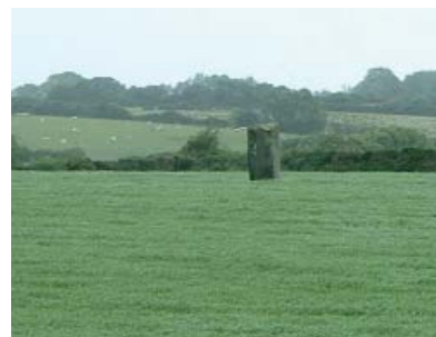
Megalito de Muff