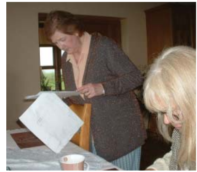
La guardiana del Megalito

Me sentí muy extraña llamando a la puerta de un desconocido, aunque pensé que no sería la primera persona en hacerlo. Una mujer contestó enseguida. “Probablemente sabrá lo que queremos, Roddy nos envió aquí”, le dije. “No hay problema, simplemente sigan las pistas que mi marido hizo con su tractor para que no pisen su cebada. Lamento que el tiempo sea tan malo.