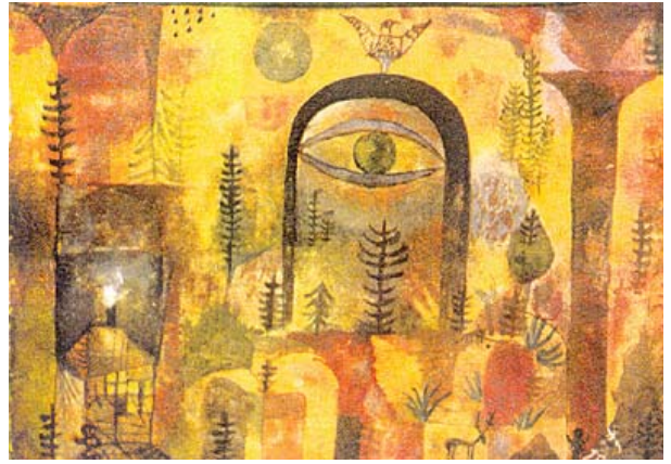
"Avec l'Aigle" Paul Klee, 1918