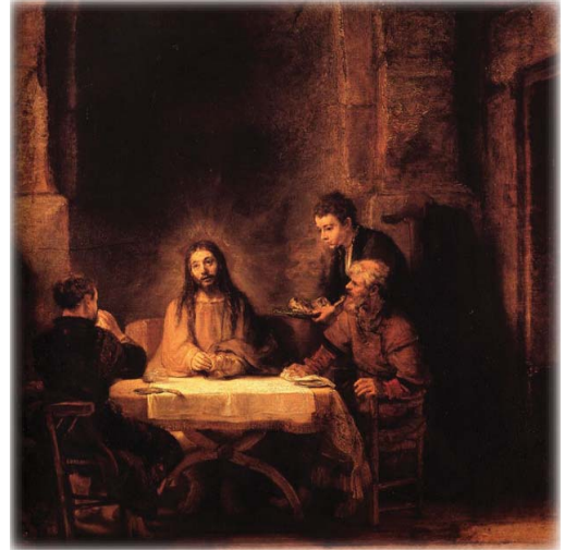
"Souper à Emmaüs" Rembrandt van Rijn, 1629

Un fragment du Père habite en nous. Notre guide peut seulement nous montrer le droit chemin Mais toujours, Nous devons choisir.