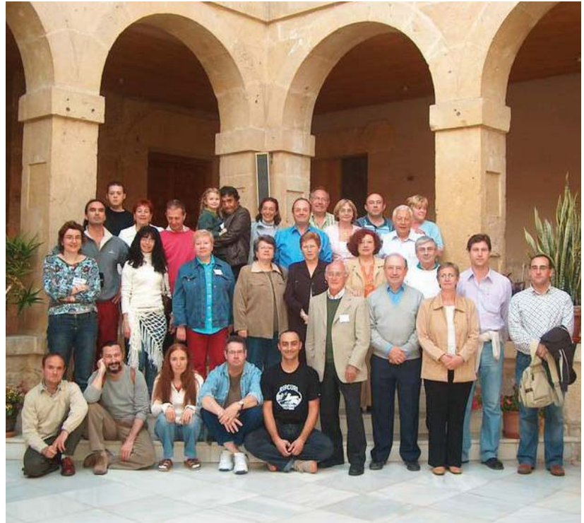
Photo de groupe

Burgos et Majorque, parmi tant d'autres endroits. Même un couple d'amis habitant en France près de la frontière espagnole est venu pour être avec nous lors de cet événement. Nous avons offerts du matériel aux participants, comme un CD avec des travaux secondaires, des lettres de nouvelles, etc., tous accessibles