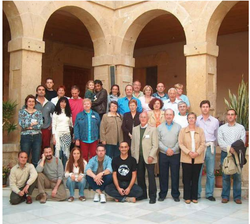
Foto de grupo

Bilbao, Valencia, Burgos y Mallorca, entre otros sitios. Incluso una pareja de amigos que viven en Francia, cerca de la frontera española, vinieron para estar con nosotros en este evento. Entregamos una serie de material a los allí presentes, como un CD con trabajos