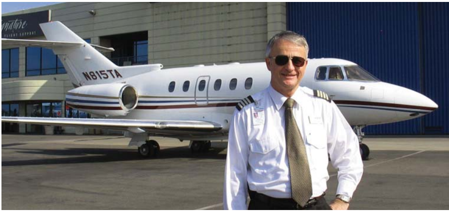
Mark con un reactor Hawk