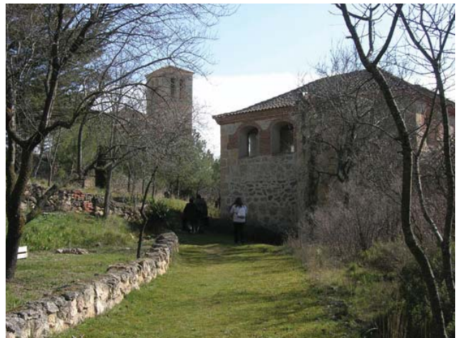
Monasterio de san Juan de la Cruz en Segovia, cerca de Madrid

Para más información, contacten por favor con nuestra asociación en urantiaesp@gmail.com .