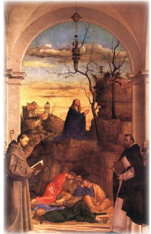
"Cristo rezando en el Jardín" Marco Basaiti, óleo en tabla, 1516

A mi amado Padre-Madre y a mi familia Sin los que yo sería sencilla y verdaderamente, nada