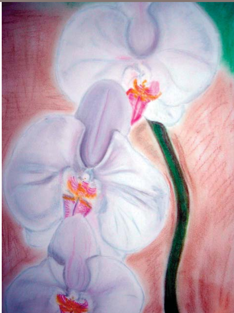
"Orquídeas de Maui" Pintura al pastel de Sheila Schneider