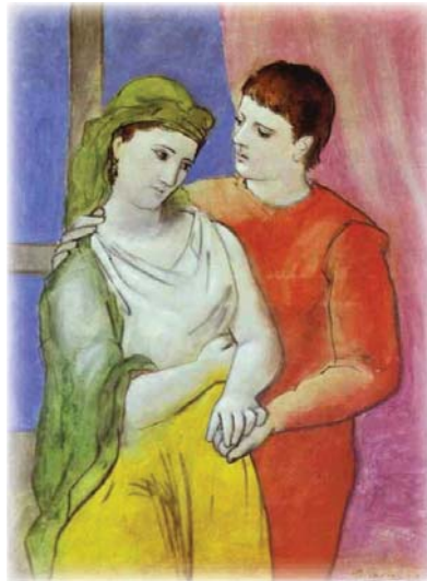
“Los amantes” Pablo Picasso, 1923

E n la vida física, los sentidos se percatan de la existencia de las cosas; la mente descubre la realidad de los significados; pero la experiencia espiritual revela al individuo los verdaderos valores de la vida. Estos altos niveles de vida humana se logran en el amor supremo de Dios y en el amor altruista del hombre. Si amas a tus semejantes, debes haber descubierto sus valores. Jesús amaba tanto a los hombres, porque les adjudicaba un valor tan alto. Puedes mejor descubrir los valores de tus asociados descubriendo sus motivaciones. Si alguien te irrita, te produce sentimientos de resentimiento, debes buscar con simpatía el discernimiento de su punto de vista, sus razones de una conducta tan censurable. Una vez que entiendas a tu prójimo, te volverás tolerante, y esta tolerancia crecerá en amistad y madurará en el amor.