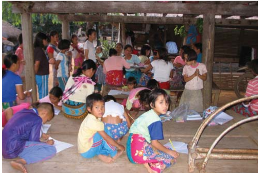
La educación dará poder para siempre a la vida de un niño. Niños asistiendo a FreeSchools en Tailandia.