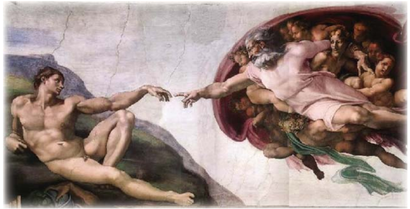
"La creación de Adán" Fresco de Michelangelo Buonarroti, 1510