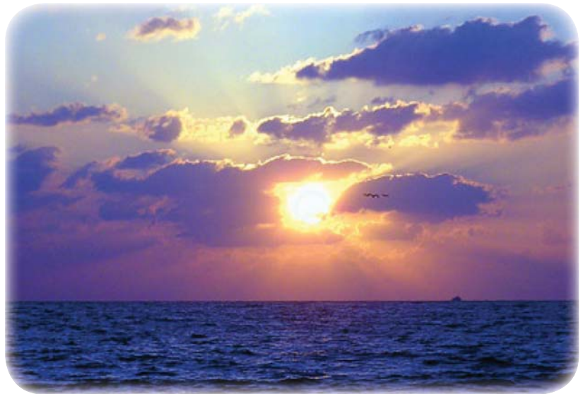
Puesta de sol en Maui

Jefe del Comité de Recaudación de Fondos de la AUI